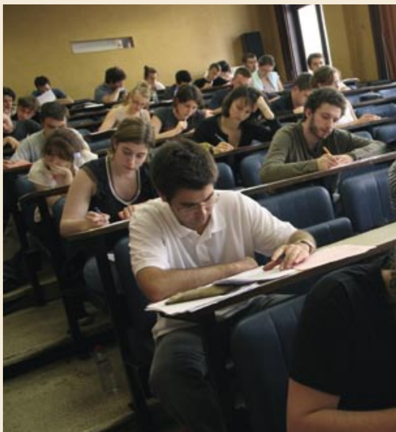
Concours PHR et JS dans les locaux de l'ESJ en juin dernier.

Ne sont pas pris en compte les candidats inscrits sur les listes d'attente.