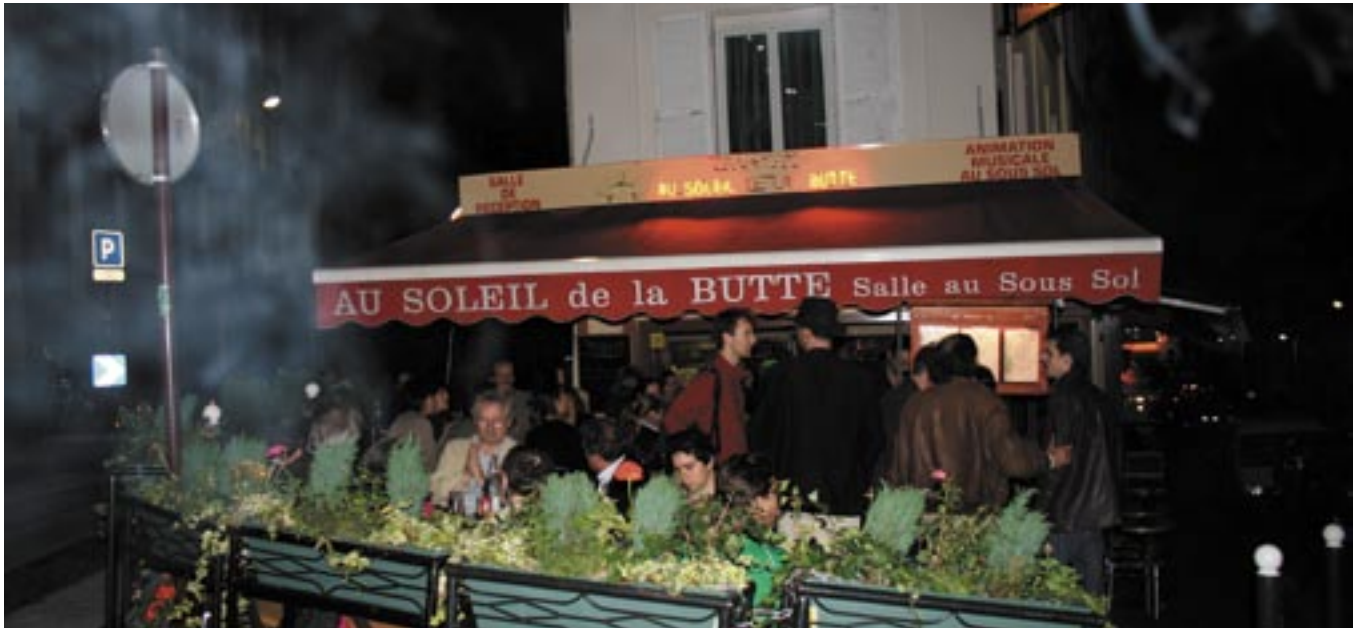
Il pleuvait au Soleil. Ça n'a pas découragé certains Anciens qui ont dîné en terrasse.