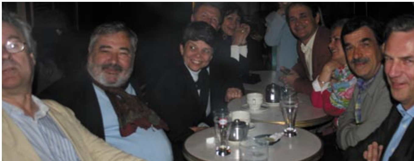
Les quarantièmes promotions (non rugissantes) ont préféré la terrasse au sous-sol (rugissant).